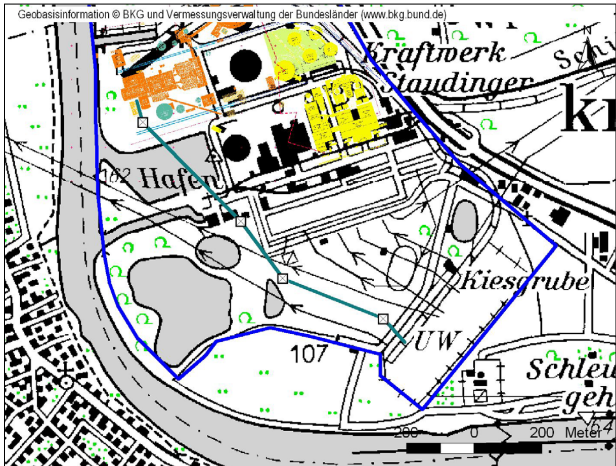
Abb. 3. -4: Lage der geplanten 380-kV-Leitung zum Umspannwerk Großkrotzenburg