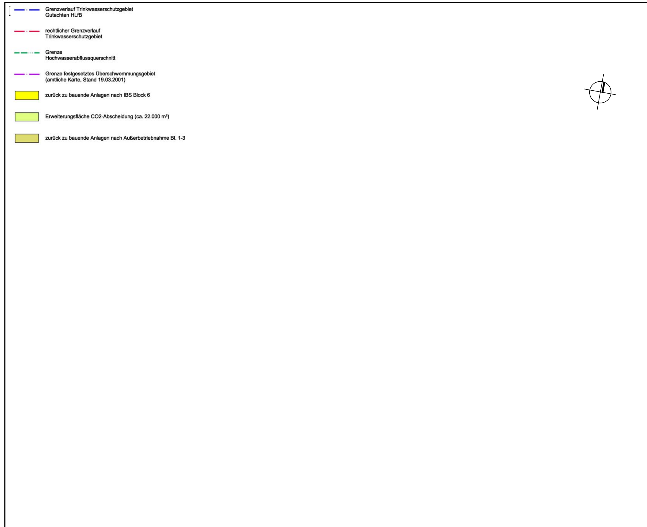
Abb. 3. -2: Lageplan des Vorhabens 1.100 MW Steinkohleblock (Block 6)