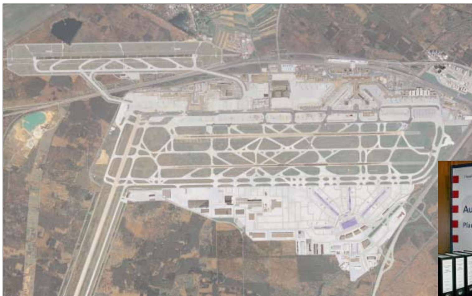
Hier landet die Zukunft: Zum Winterflugplan 2011 soll die Landebahn Nordwest (im Modell-Bild links oben) in Betrieb gehen; der Bau des Terminal 3 (vorne rechts) wird in mehreren Abschnitten nach dem jeweiligen Bedarf ausgerichtet und 2020 abgeschlossen sein; zu diesem Zeitpunkt erwartet der Frankfurter Flughafen-Betreiber an Deutschlands zentralem Luftfahrtstandort mehr als 88 Millionen Passagiere