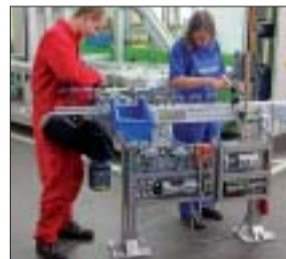
Die Fraport-Stiftung ProRegion fördert die berufliche Bildung

die Erich-Becker-Stiftung und ProRegion – ausgegeben. Auch dies dokumentiere die sozialpolitische Verantwortung des Unternehmens, das