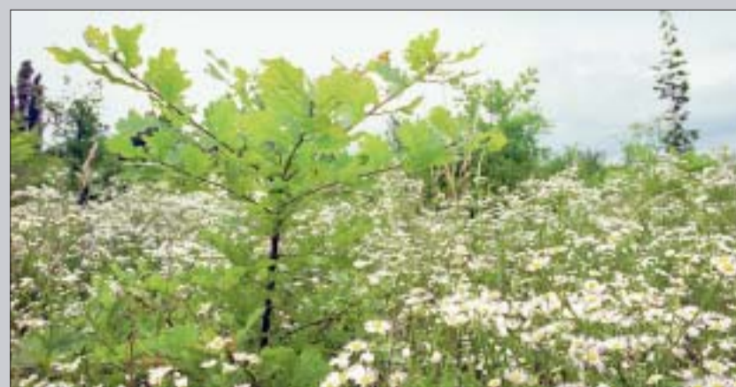
Wiederaufforstung betreibt die Fraport AG bereits seit vielen Jahren mit Erfolg

Heute sind etwa 3.700 Hektar Flora und Fauna rund um den Flughafen nach euro-