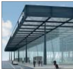
Terminal 3 (Simulation)

es angesichts dessen, dass die Arbeitsplatzprognosen, die beim Bau der Startbahn 18 West erstellt wurden, weit übertroffen wurden?