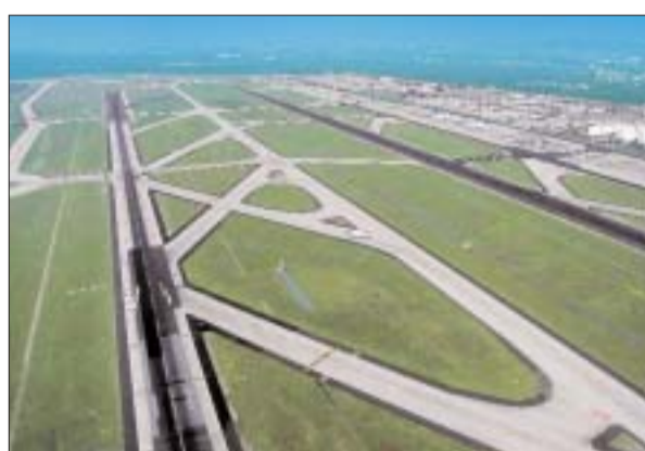
Eine Versetzung des Aufsetzpunktes beim Landen nach hinten könnte Anrainer im Osten und Westen entlasten

gionalen Dialogforum zwischen den Kommunen und den Unternehmen der Luftverkehrsbranche erörterten Lärmschutzmaßnahmen schon vor der Inbetriebnahme der neuen Landebahn durch die in der gemeinsamen Erklärung angekündigten Schritte eingeleitet und einer Umsetzung zugeführt werden und der unverzichtbare Dialog in seiner institutionalisierten Form auch über den Planfeststellungsbeschluss hinaus aktiv fortgeführt wird. Das Land wird in seiner Rolle als Aufsichtsbehörde für den Flughafen seine Spielräu-