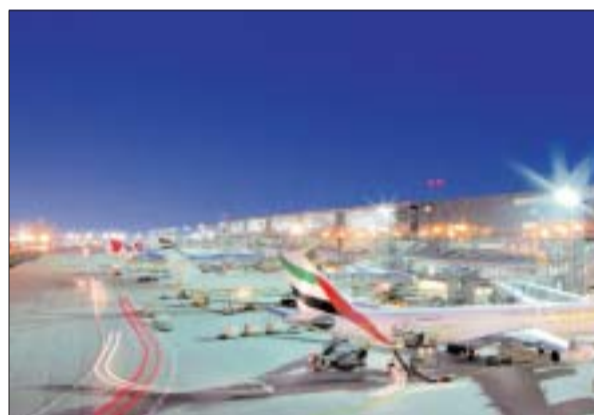
Nachts wird es nach dem Ausbau am Airport deutlich weniger Flugbetrieb geben als zurzeit