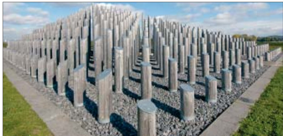
Aktiv für die Region: Die Stangenpyramide bei Dreieich ist nur ein kleiner Teil des Regionalparks, den die Fraport AG seit zehn Jahren finanziell maßgeblich unterstützt