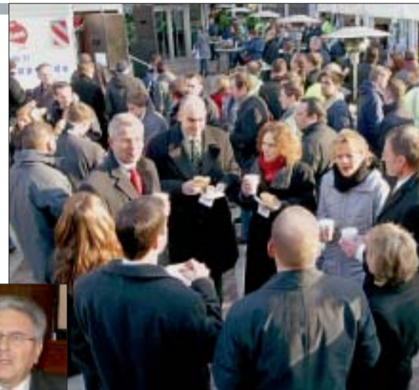
Spontane Feier: Fraport-Mitarbeiter freuen sich über die Sicherung ihrer Arbeitsplätze

nun so schnell wie möglich die Bagger anrollen. „Der Planfeststellungsbeschluss steht am Ende eines langjährigen Verfahrens“, kritisierte der Betriebsratschef. Die Arbeitnehmer und deren Vertreter erwarteten von der Politik, dass es gelinge, Genehmigungsverfahren für Großprojekte „zu vereinfachen und zu entschleunigen“. Wichtel: „Nur so können wir als Standort noch wettbewerbsfähig bleiben.“