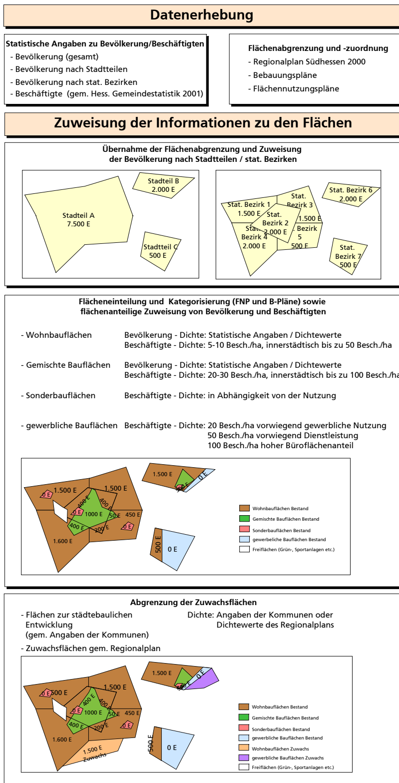
Abb. 4-1: Methodik der Flächenabgrenzung und Zuweisung der flächenbezogenen Daten